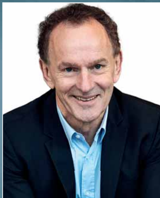
Formand for rektorkollegiet

Vores studerende fra for eksempel de baltiske lande, Tyskland og Frankrig har været med til at skabe et internationalt miljø til gavn for danske medstuderende og erhvervsakademierne. Og virksomhederne har haft gavn af de internationale studerende. Danmark er et lille land, og vi har brug for ideer og inspiration fra verden omkring os. Vi er afhængige af samhandel og samarbejdet med andre lande, og det gælder også på uddannelsesområdet. Det er blevet markant sværere med den nye aftale.