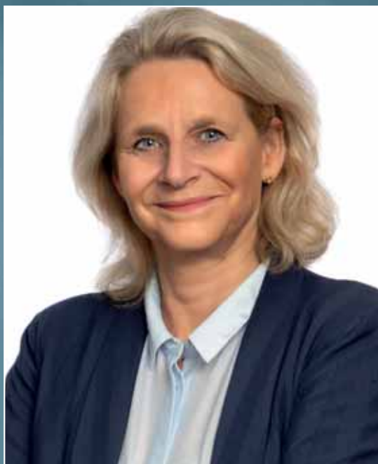
Formand for bestyrelsen